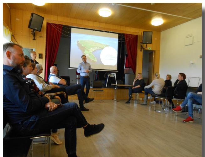
Íbúafundur í verkefninu Glæðum Grímsey.

Í henni eiga sæti fulltrúar Byggðastofnunar, viðkomandi sveitarfélags, landshlutasamtaka og atvinnuþróunarfélags ásamt fulltrúum íbúa sem að jafnaði eru tveir. Dæmi eru þó um fleiri fulltrúa íbúa. Verkefnisstjórn fundar reglubundið ýmist með fjarfundasniði eða í þátttökubbyggðarlagi. Eitt mikilvægasta hlutverk verkefnisstjórnar í hverju þátttökubbyggðarlagi er að móta verkefnisáætlun og tryggja að henni sé fylgt, auk þess að móta stefnu varðandi kynningu á verkefninu fyrir viðkomandi byggðarlag.