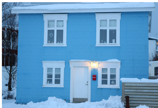
Vetrarstemning í Hrísey.

Fullyrða má að styrkirirnir hafi haft mikil og hvetjandi áhrif í samfélögum. Mörg verkefni hafa ýmist sótt í sig veðrið, eða jafnvel hafist í kjölfar styrkumsóknar. Yfirlit yfir styrkt verkefni má sjá í umfjöllun í köflum um einstök byggðarlög.