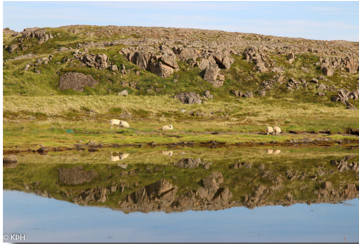
Sumarkyrrö við Steingrímsfjörð.

Á árinu 2020 var Byggðastofnun aðili að sjö verkefnum undir merkjum Brothættra byggða. Þau eru: