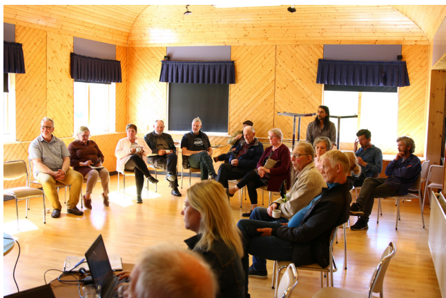
Íbúafundur í Árneshreppi.