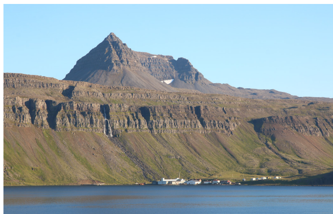
Djúpavík við Reykjarfjörð. Pottfjall gnæfir yfir.

Verkefnisstjórn hélt sex fundi á árinu, 26. febrúar, 16. apríl, 29. maí, 14. ágúst, 8. september og 7. desember. Undirbúningshópur styrkveitinga Áfram Árneshrepps fundaði auk þess tvisvar sinnum þ.e. 20. og 26. apríl, en formleg úthlutun styrkja úr Frumkvæðissjóði fór fram í Árneshreppi 24. júní. Íbúafundur var haldinn í félagsheimilinu í Trékyllisvík 17. ágúst. Allgóð þátttaka var á fundinum og fundarmenn sammála um að greina hismið frá kjarnanum, einbeita sér að því sem raunverulega skipti máli. Auk þeirra hafa verið haldnir mánaðarlegir fundir með öðrum verkefnisstjórum Brothættra byggða.