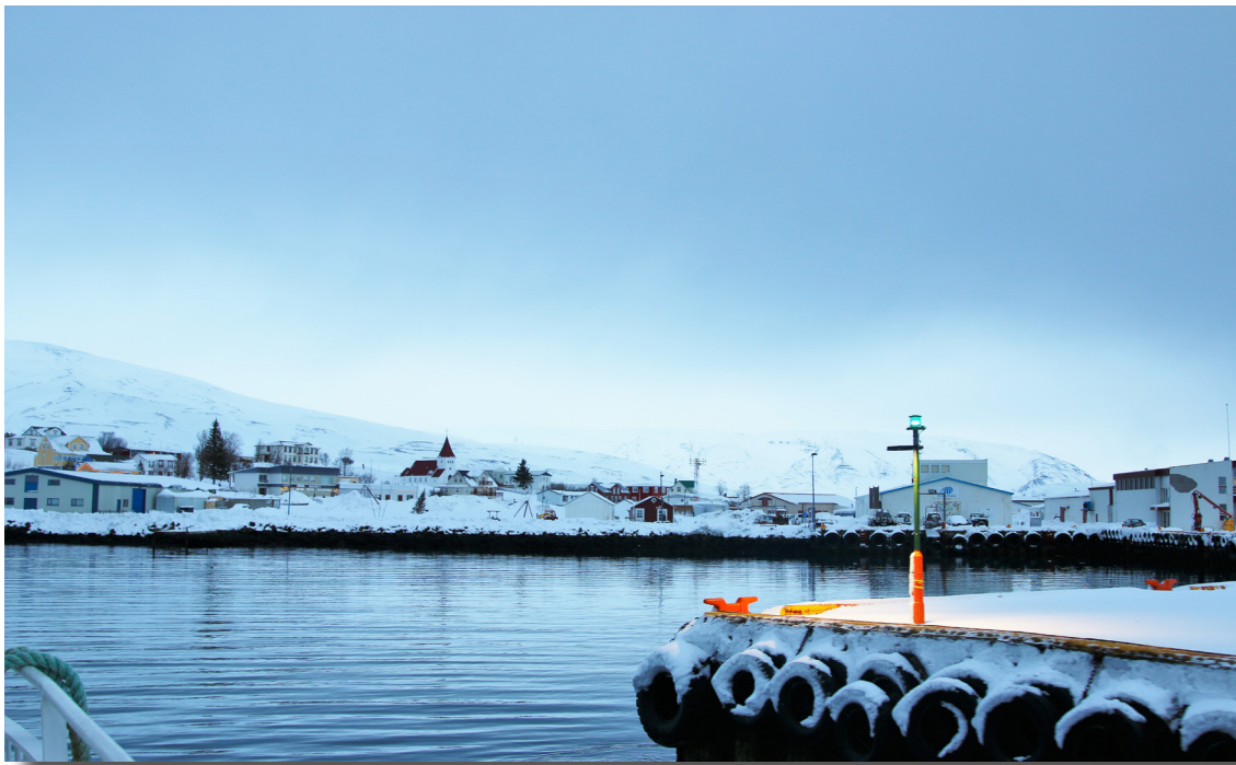
Komið í Hríseyjarhöfn.

Brothættra byggða. Ástæða þessa var vegna sérstaks fjárfestingarátaks stjórnvalda vegna COVID-19. Því hefur ekkert verkefni haft jafn mikla fjármuni og Sterkar Strandir til úthlutunar við upphaf verkefnisins, en á móti kemur að vegna þeirra flóknu aðstæðna sem upp hafa komið sökum heimsfaraldurs fékk verkefnið í upphafi ekki þann slagkraft og samhljóm innan samfélagsins og ætla hefði mátt að það hefði fengið í árferði án samkomutakmarkana að mati verkefnisstjóra. Segja má að verkefnið hafi farið hægar af stað en ella, en sé nú að komast á fullt skrið. Íbúar eru stöðugt betur að átta sig á þeim tækifærum sem í verkefninu felast og aukinn kraftur er að færast í verkefnið.