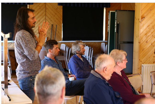
Íbúafundur í Árneshreppi.