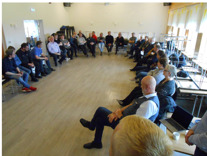
Íbúafundur í Grímsey.