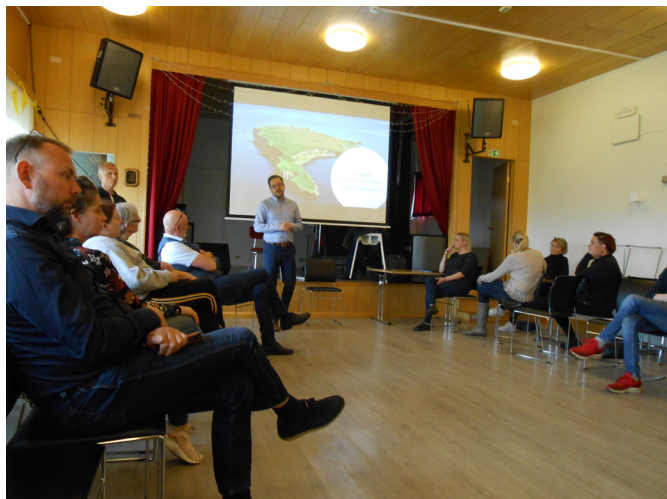
Íbúafundur í Grímsey.

Reynslan af byggðapróunarverkefninu Glæðum Grímsey sýnir að verkefni af þessu tagi skiptir miklu máli fyrir byggðarlagið og framþróun þess. Styrkveitingar úr Frumkvæðissjóði hafa hvatt íbúa til góðra verka, nýsköpunar og samstöðu um málefni byggðarlagsins m.t.t. sóknarfæra í atvinnulífi og til eflingar samfélagslegra þátta. Þar má t.d. nefna að mikil nýsköpun og frumkvöðlastarf hefur átt sér stað á sviði ferðapjónustu og ný fyrirtæki hafið starfsemi. Atvinnuráðgjafar SSNE hafa aðstoðað frumkvöðla eftir því sem leitað hefur verið eftir. Verkefni sem miða að nýtingu raforku m.t.t. uppsetningar á vindmyllum og sólarrafhlöðum er hafið. Verkefnastjórar hafa á tímabilinu unnið að því að koma sjónarmiðum Grímseyinga á framfæri í stjórnýslunni hvað varðar hagsmunamál byggðarlagsins. Íbúafjöldi hefur staðið í stað á árinu 2020. Þegar þetta er ritað hafa stjórnvöld einnig tekið ákvörðun um að verkefnið Glæðum Grímsey verði framlengt til loka árs 2022.