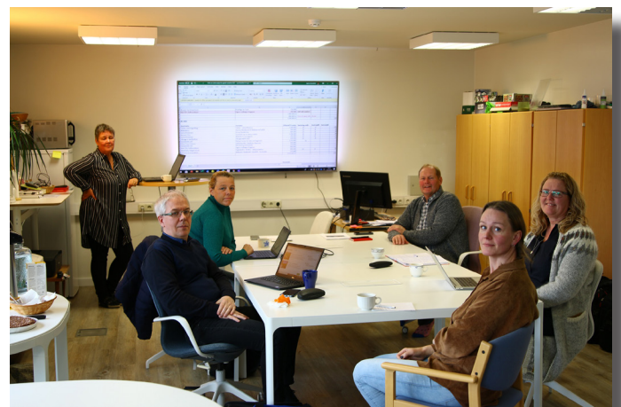
Verkefnisstjórn fundar í Blábankanum á Þingeyri.