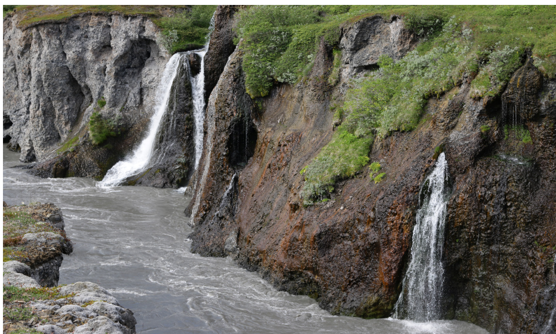
Í Forvöðum í Þjóðgarðinum í Jökulsárgljúfrum.