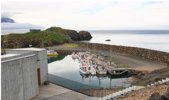
Höfnin á Borgarfirði eystri.

Níu ár eru síðan verkefnið Brothættar byggðir hóf göngu sína. Í upphafi verkefnisins var hugmyndin sú að búa til aðferð eða verklag sem hægt væri að yfirfæra á byggðarlög sem stæðu frammi fyrir sambærilegum vanda, þ.e. viðvarandi fækkun íbúa og erfiðleikum í atvinnulífi. Raufarhöfn var fyrsta byggðarlagið sem tók þátt í verkefninu Brothættum byggðum. Verkefnið Raufarhöfn og framtíðin hófst árið 2012 og því lauk árið 2018.