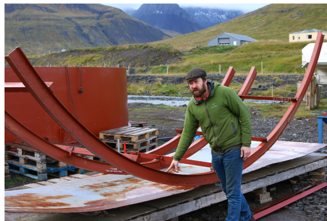
Af smíði Tanksins á Þingeyri.