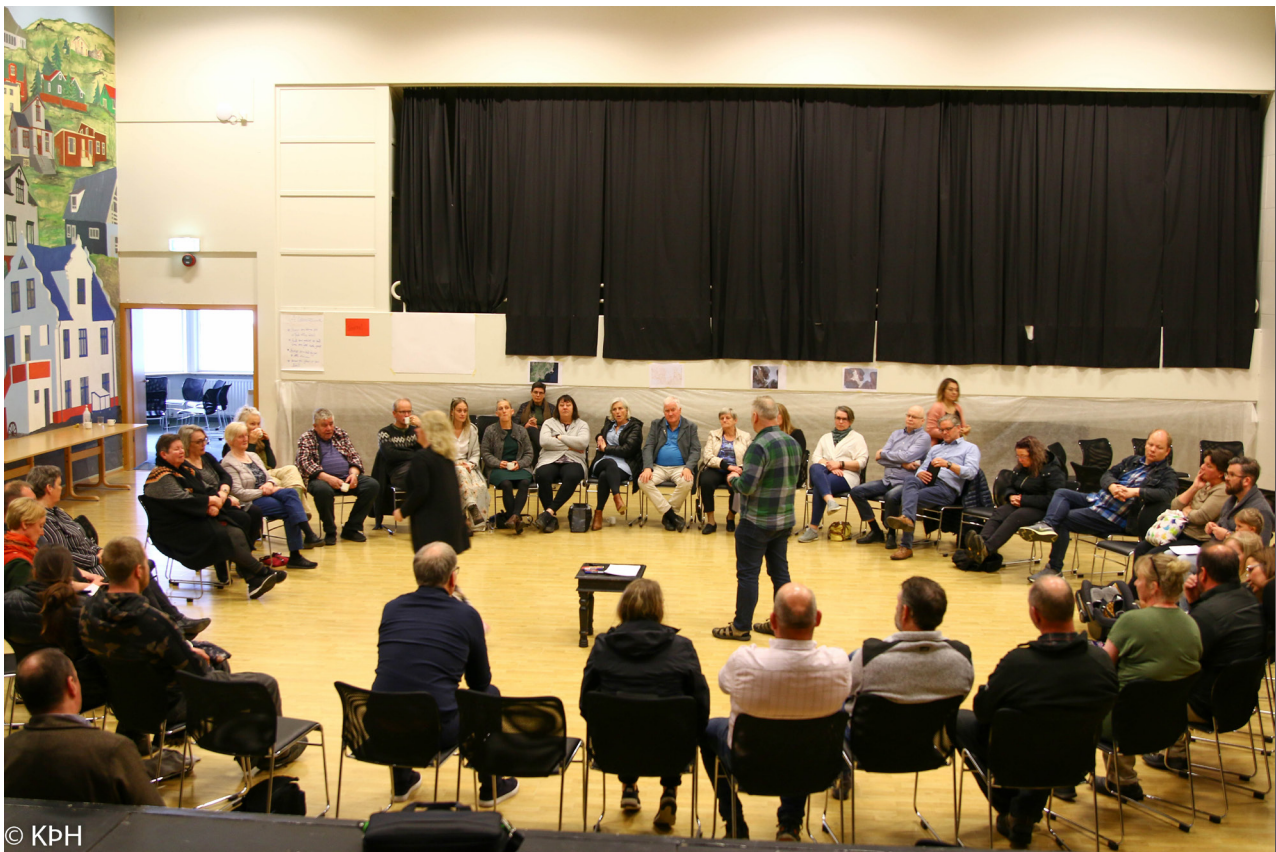
Frá íbúáþingi í Strandabyggð.

Stefnt er að því að gera árlega könnun meðal verkefnisstjórna þátttökubyggðarlaganna. Gerð var könnun á viðhorfi styrkhafa í Brothættum byggðum í nóvember 2020 og í lok árs 2019 / upphafi árs 2020 var gerð könnun á viðhorfum verkefnisstjórnarfulltrúa til verkefnisins og framkvæmdar þess. Fjallað er ýtarlega um niðurstöðurnar í ársskýrslu Brothættra byggða fyrir árið 2019, 8. og 9. kafla, sjá hér . Ekki hafa verið gerðar nýjar kannanir á árinu 2021 þegar þetta er ritað.