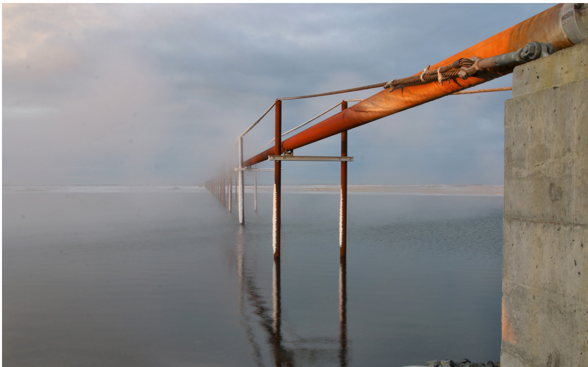
Hitaveitulögn við Skógalón í Öxarfirði.

Svo sem sjá má á undirmerkiðunum er lykilatriði að fá fram skoðanir íbúanna sjálfra á framtíðarmöguleikum heimabyggðarinnar og leita lausna á þeirra forsendum í samvinnu við ríkisvaldið, landshlutasamtök, atvinnuþróunarfélög, sveitarfélagið, brottflutta íbúa og aðra hagaðila.