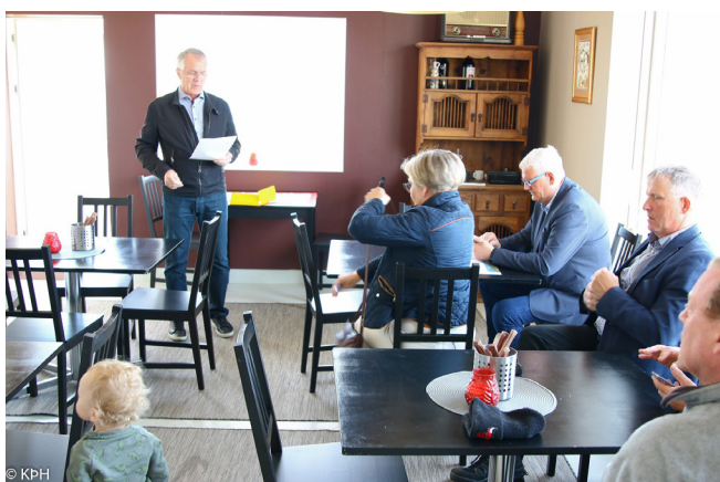
Úthlutun styrkja í verkefninu Betri Bakkafjörður.