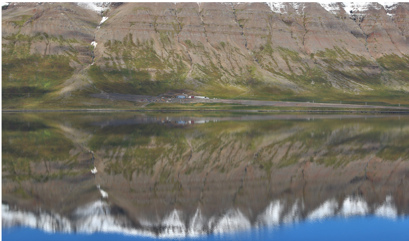
Lokafrágangur við Dýrafjarðargöng, Arnarfjarðarmegin.