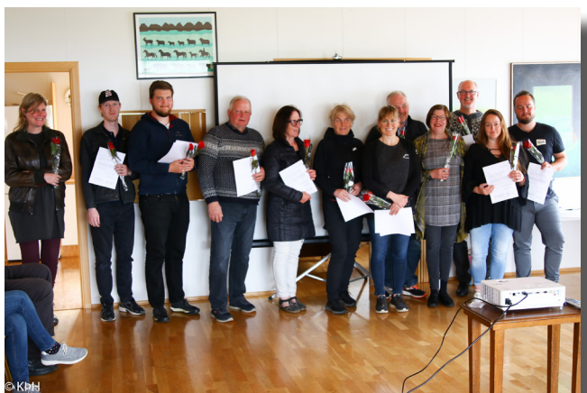
Úthlutun styrkja í verkefninu Betri Borgarfjörður.