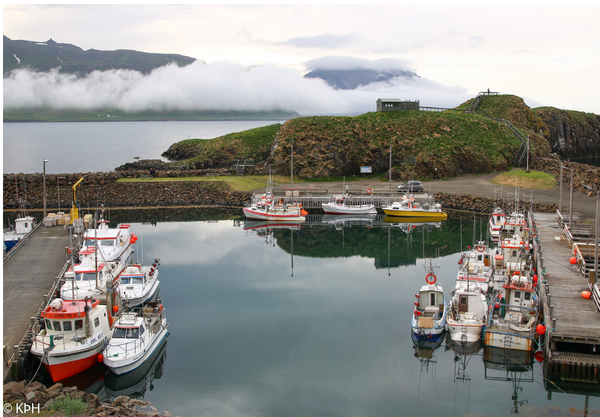
Höfnin og Hafnarhólmi Borgarfirði eystri.